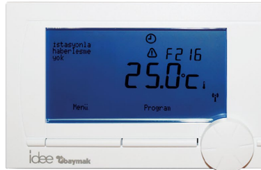
Kablolu Programlanabilir Oda Termostati (16900402)