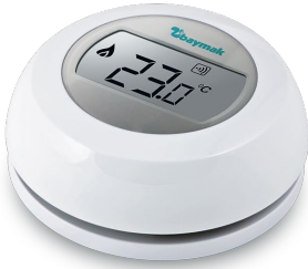
Connect Akıllı Oda Termostati (100020843)