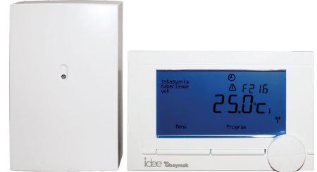
Kablosuz Programlanabilir Oda Termostati (16900403)